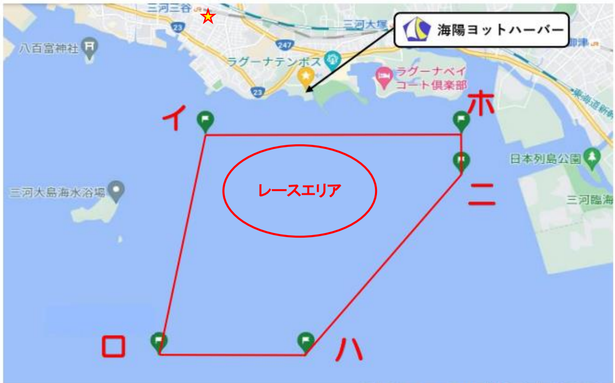
【添付図A】 「レース・エリア」